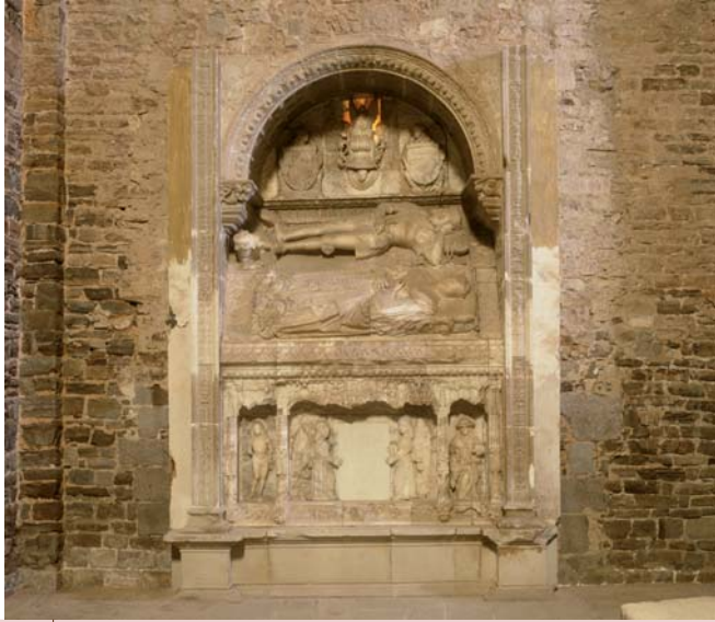
Tomba de Ferran Joan Ramon Folc, segon duc de Cardona, i la seva muller Francisca.