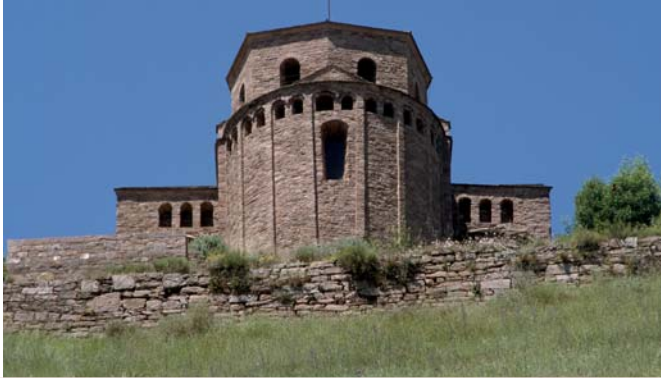
La capçalera de la canònica de Sant Vicenç de Cardona.