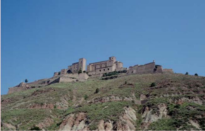
Conjunt monumental del castell i la canònica de Cardona