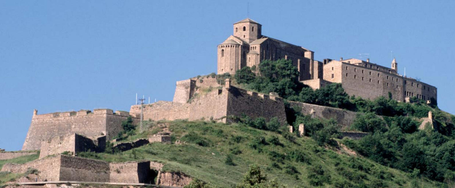
Vista general del castell i la canònica de Sant Vicenç de Cardona