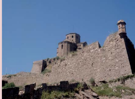
L'absis i els baluards del castell.