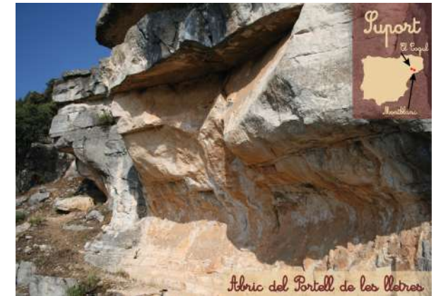
Abric del Portell de les lletres