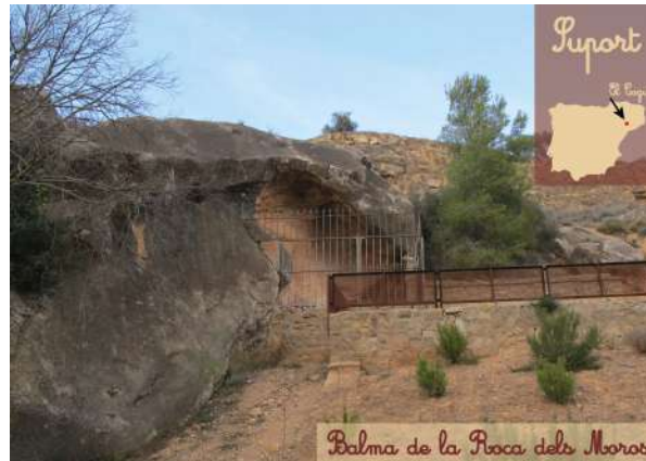
Balma de la Roca dels Moros