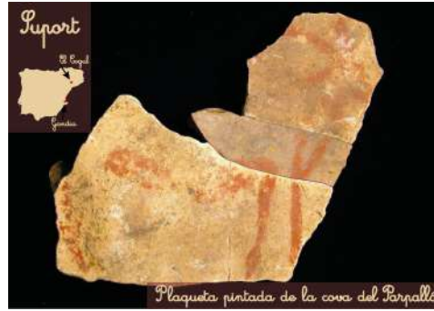
Plaqueta pintada de la cova del Barralló