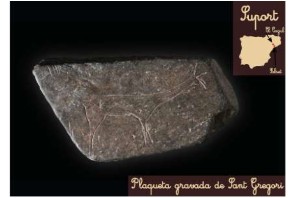
Plaqueta gravada de Sant Gregori