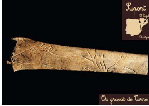
Os gravat de Torre